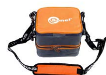
Custodia M-8 WAFUTM8