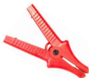
Terminale a coccodrillo rosso 11 kV 32 A WAKRORE32K09