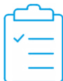
Certificato di calibrazione di fabbrica