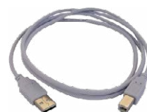
Cavo per trasmissione dati USB WAPRZUSB