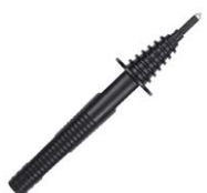
Terminale a puntale nero 5 kV (innesto a banana) WASONBLOGB2