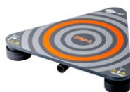
Sensore per misure della resistenza dei pavimenti e delle pareti PRS-1 WASONPRS1