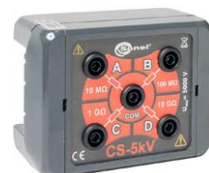
Scatola di calibrazione CS-5 kV WAADACS5KV