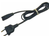
Cavo di alimentazione 230 V (pin IEC C7) WAPRZLAD230