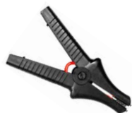
Terminale a coccodrillo nero 11 kV 32 A WAKROBL32K09