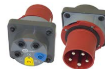
Adaptador AGT para enchufe trifásico 63 A