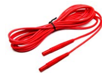
Cable 5 / 10 / 20 m rojo 1 kV (conecto- res tipo banana)