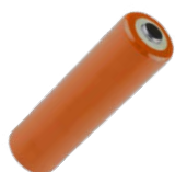
4x batería LR6 1,5 V