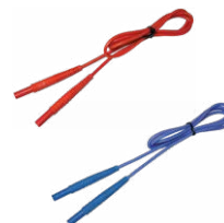
Cable 1,2 m 1 kV (conectores tipo banana) rojo / azul