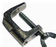
Mordaza (conector tipo banana)