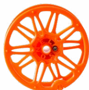
Carrete para enrollar el cable de medición