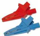
Cocodrilo 1 kV 20 A rojo / azul