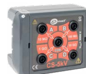
Adaptador caja de calibración CS-5 kV