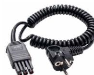
Adaptador WS-04 (conector angular UNI-Schuko)