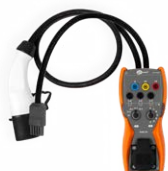
Adaptador para probar estaciones de carga de vehículos EVSE-01