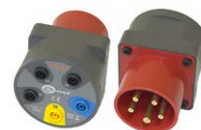
Adaptador AGT para enchufe trifásico 16 A / 32 A