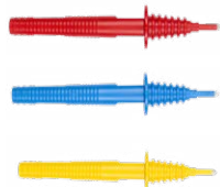
Sonda de punta 1 kV (toma tipo banana) roja / azul / amarilla