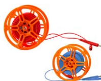
Cable para medir la toma de tierra en carrete (conectores tipo banana) 25 m rojo / azul