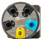
Adaptador CS-1 - simulador de cable