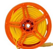
Cable para medir la toma de tierra en carrete (conectores tipo banana) 50 m amarillo