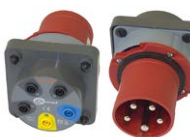
Adaptador AGT para enchufe trifásico 63 A