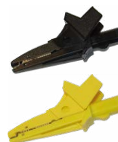
Cocodrilo 1 kV 20 A negro / amarillo