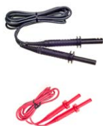
Cable 5 kV 1,8 m (conectores tipo banana) negro blindado / rojo