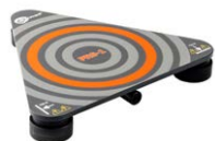
Sonda para medir la resistencia de suelos y paredes PRS-1