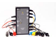
Adaptador AutoISO-1000C para la medición automática de la resistencia de aislamiento de cables multifilares