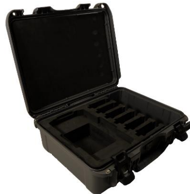
Caja de transporte de plástico para TWR-H, TRT-H & RMO-TH