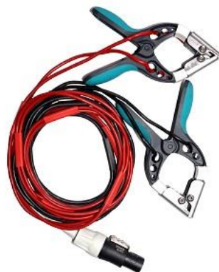
Cables de corriente y voltaje bobinado X lado de baja con pequeñas pinzas TTA