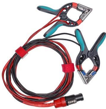
Cables de corriente y voltaje bobinado H lado de alta con pequeñas pinzas TTA