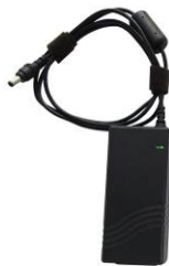
Cable de suministro con adaptador fuente de poder 18 V / 3 A