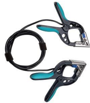
Cable cortocircuito con pequeñas pinzas TTA